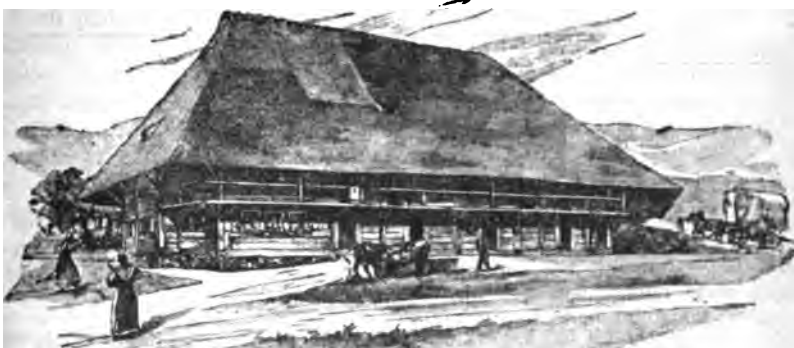
Probe der Abbildungen.

«Dieses Buch bietet sich dem wachsenden Betriebe der deutschen Volkskunde als Führer an. Nicht nur fühlen die Germanisten, dass dieser Zweig ihrer Wissenschaft zu seinem Gedeihen noch weiterer besonnener Pflege und Leitung bedarf, sondern auch viele Gebildete, von unseren höchsten Beamten bis zu